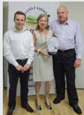
Restaurante Per Mangiare