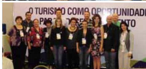
Secretaria Educação, Cultura e Desporto de São Marcos