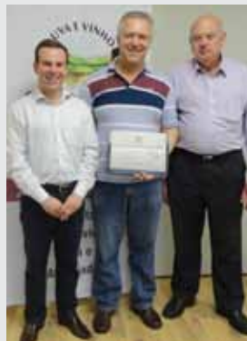
Churrascaria Gaudério e Gaudério Grill