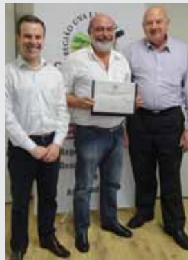
Motel Giro D'Água