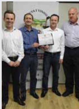
Ristorante Casa Di Paolo