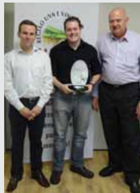
Restaurante e Galeteria Alvorada